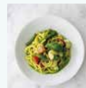
海老とトマトの ジェノベーゼ タリオリーニ