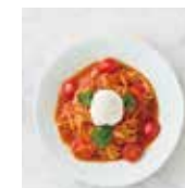
ポモドーロ スパゲティ ブルラータのせ