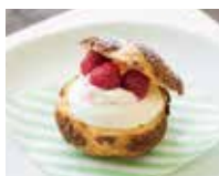
BIGNÈ DI LAMPONI ラズベリービニエ