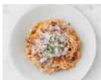
TAGLIATELLE ALLA BOLOGNESE 牛ひき肉のボロネーゼ タリアテッレ