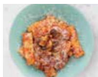
RIGATONI ALL' AMATRICIANA アマトリチャーナ ソース リガトーニ