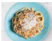
PICI ALLA NORCINA 豚ひき肉と ボルチーニの 煮込みソース ピチ