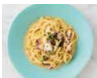
TAGLIOLINI CON POLPO E LIMONE タコとアンチョビ レモンバター タリオリーニ