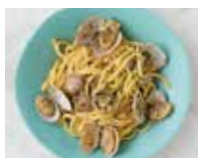
TAGLIOLINI ALLE VONGOLE ボンゴレビアンコ タリオリーニ