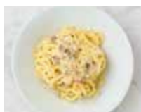
SPAGHETTI ALLA CARBONARA カルボナーラ スパゲティ