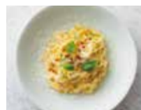
TAGLIATELLE AL LIMONE CON PEPE ROSA レモンバターソース タリアテッレ