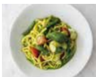
TAGLIOLINI ALLA GENOVESE 海老とトマトの ジェノベーゼ タリオリーニ