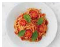
SPAGHETTI AL POMODORO ポモドーロ スパゲティ