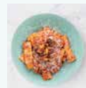
アマトリチャーナ ソース リガトーニ