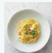
レモンバターソース タリアテッレ