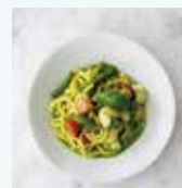
海老とトマトの ジェノベーゼ タリオリーニ