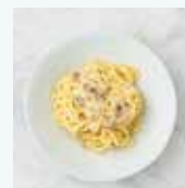
カルボナーラ スパゲティ