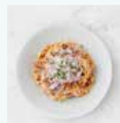
牛ひき肉の ボロネーゼ タリアテッレ