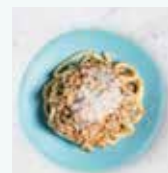
豚ひき肉と ボルチーニの煮込み ソース ピチ