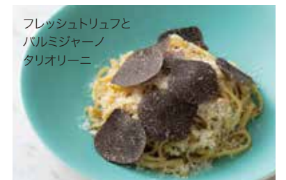
フレッシュトリュフと パルミジャーノ タリオリーニ