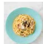
タコとアンチョビ レモンバター タリオリーニ