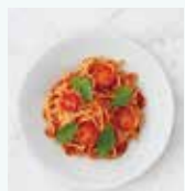
ボモドーロ スパゲティ