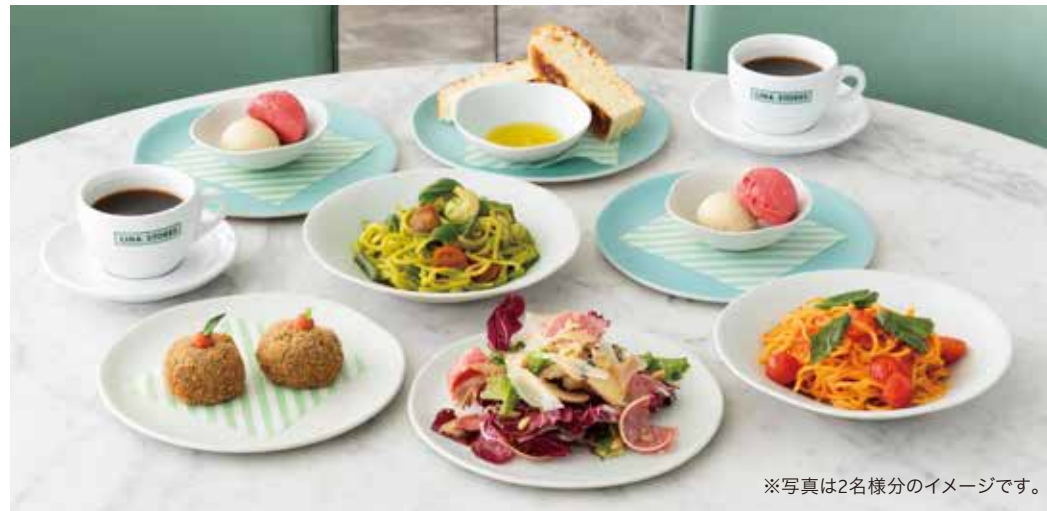
※写真は2名様分のイメージです。